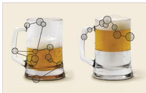
Videoanalyse mit eingeblendeten Blickbewegungen und dem Mental-Workload-Index (MWA)